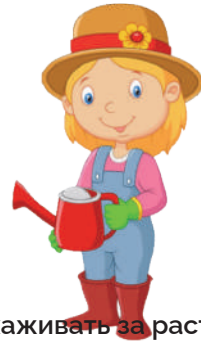
Ухаживать за растениями: