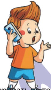
Разговаривать по телефону: