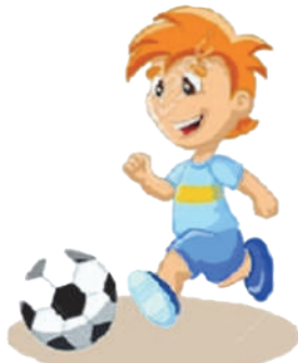
Играть в футбол: