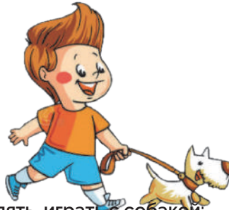
Гулять, играть с собакой: