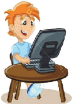
Играть в компьютерные игры: