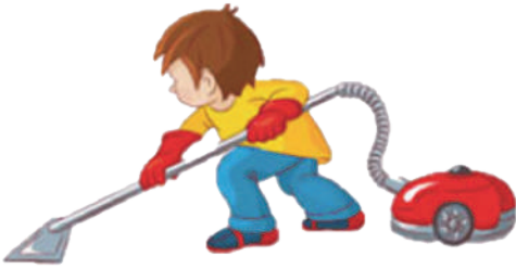
Наводить порядок дома: