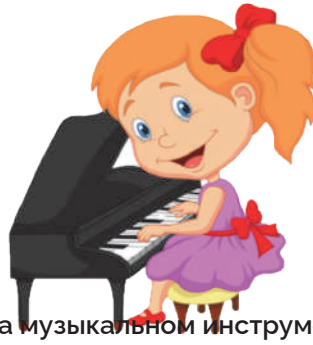
Играть на музыкальном инструменте: